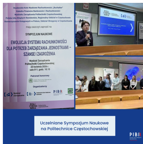
Uczelniane Sympozjum Naukowe na Politechnice Częstochowskiej